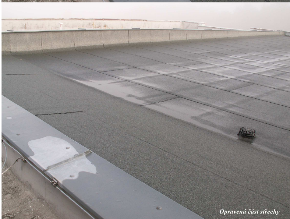
Opravená část střechy