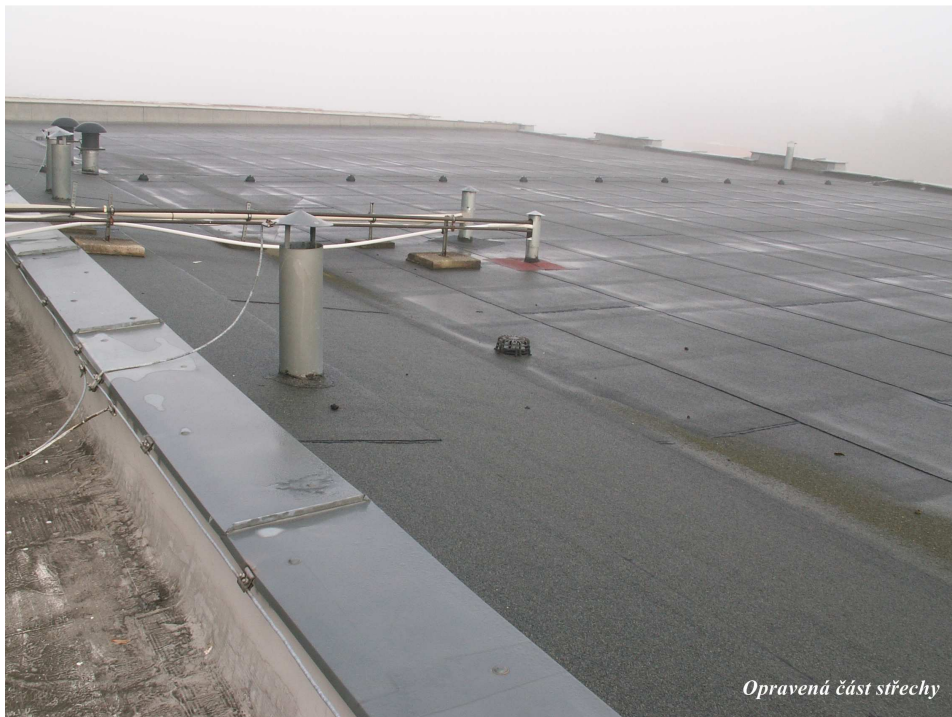
Opravená část střechy