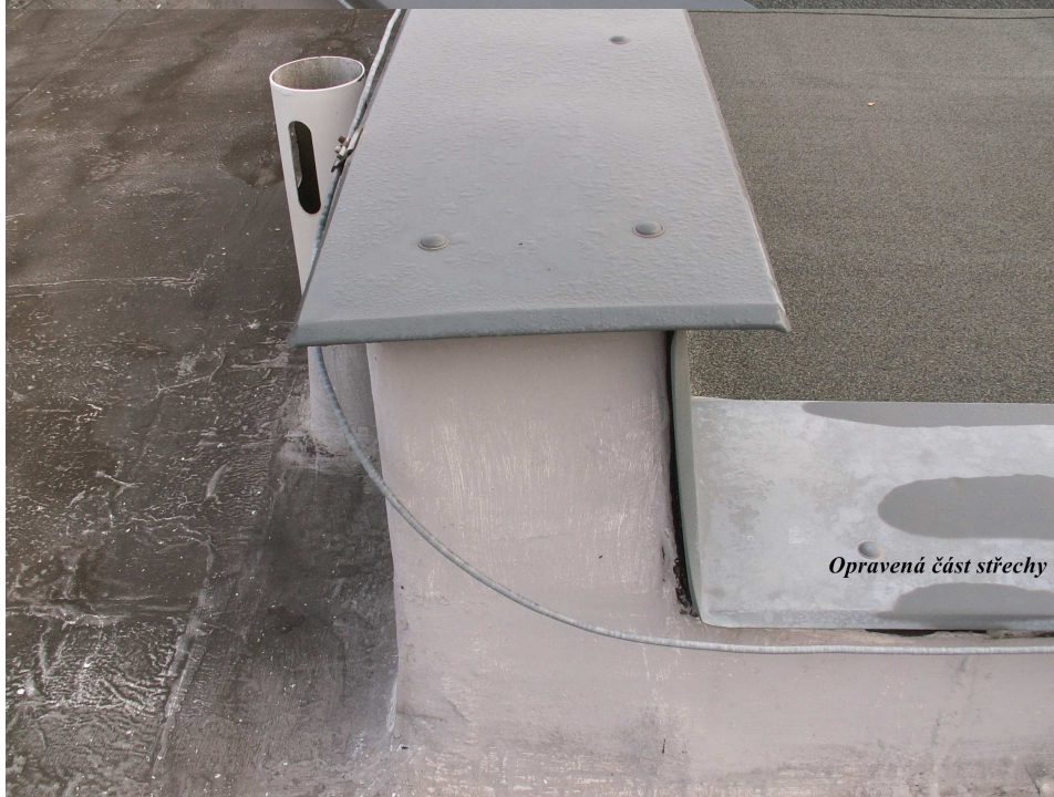
Opravená část střechy