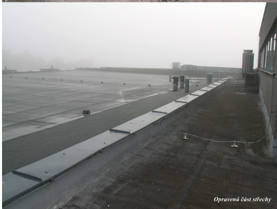
Opravená část střechy