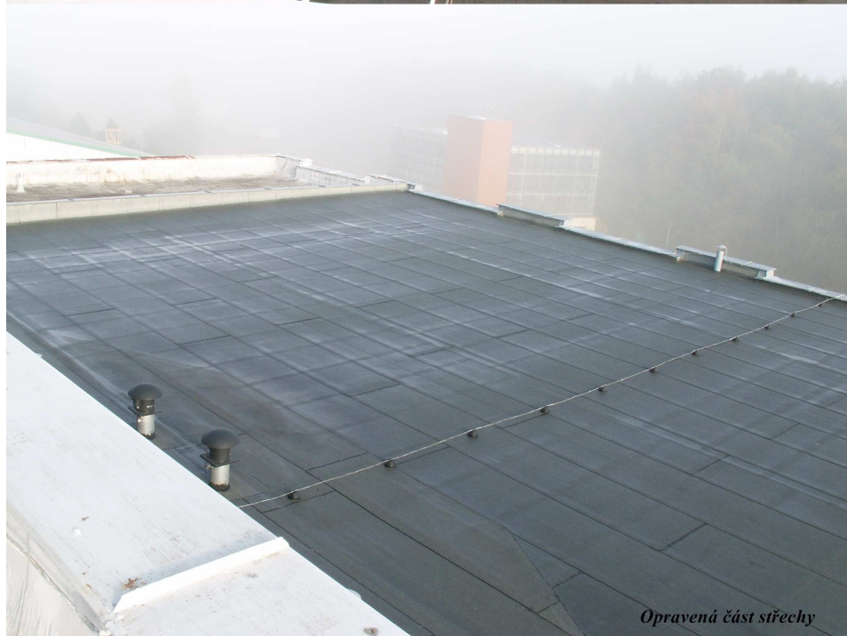
Opravená část střechy