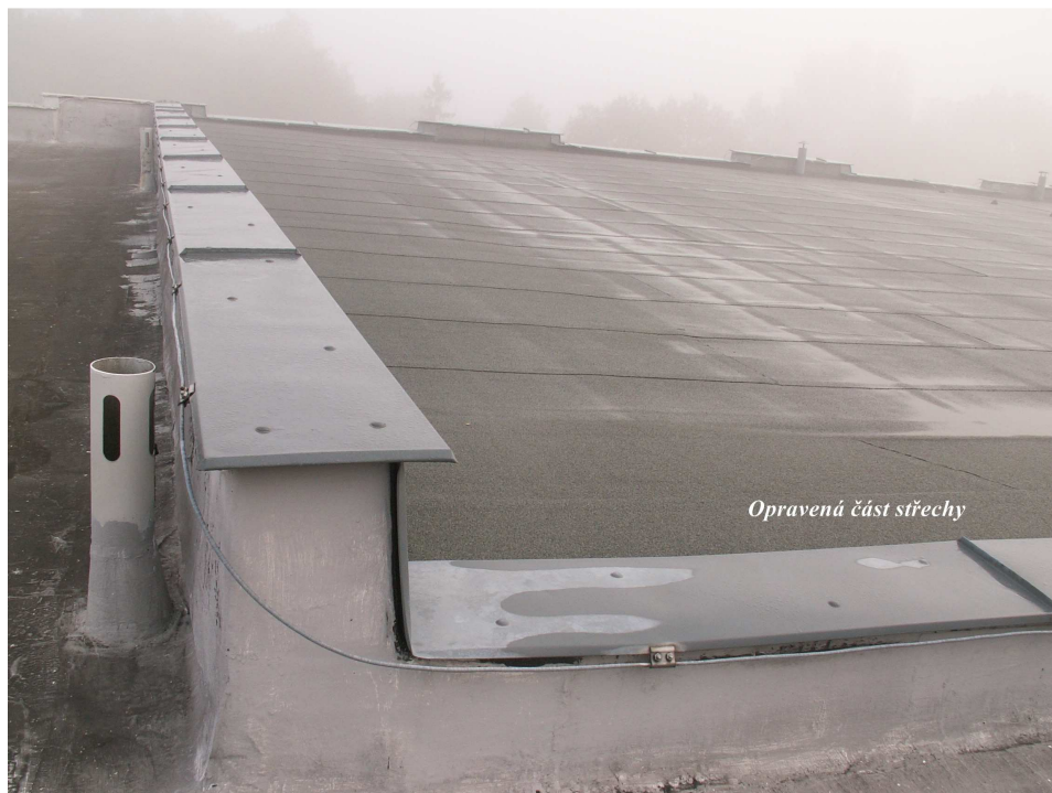
Opravená část střechy