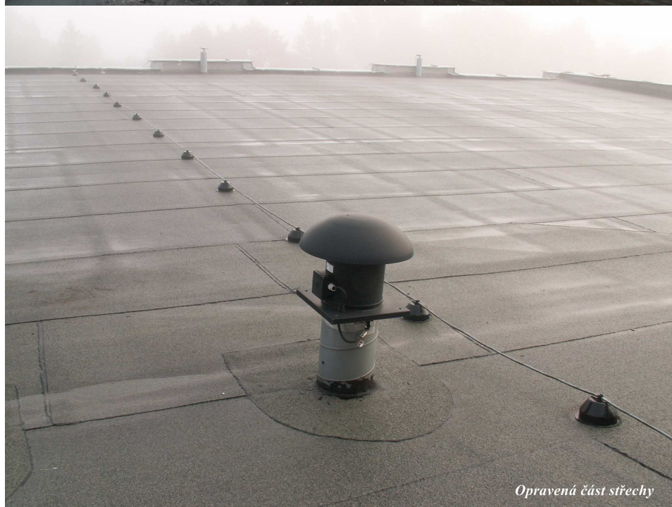
Opravená část střechy